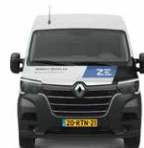
RENAULT TRUCKS MASTER Z.E.