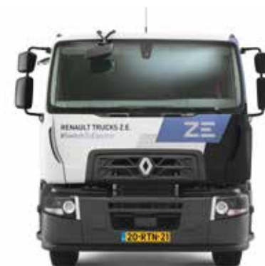
RENAULT TRUCKS D WIDE Z.E.