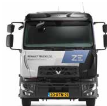
RENAULT TRUCKS D Z.E.